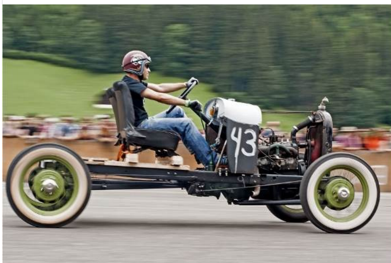
Einzigartiges Highlight am Hangar Rockin' in St. Stephan: «18 Mile Old Style Hot Rod & Motorbike Show Race & Scooter Run»