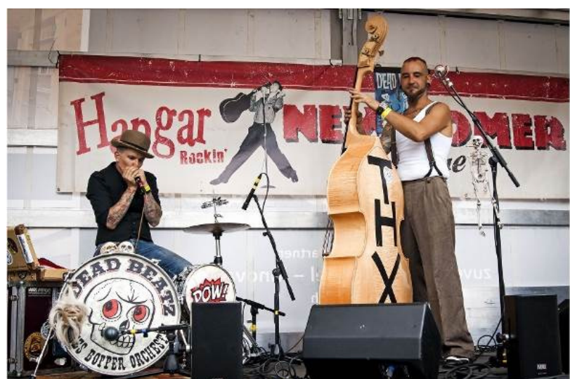
«Dead Beatz» aus Österreich gewannen den Newcomer Contest und eröffnen in einem Jahr die Live-Konzerte am Hangar Rockin' 2015