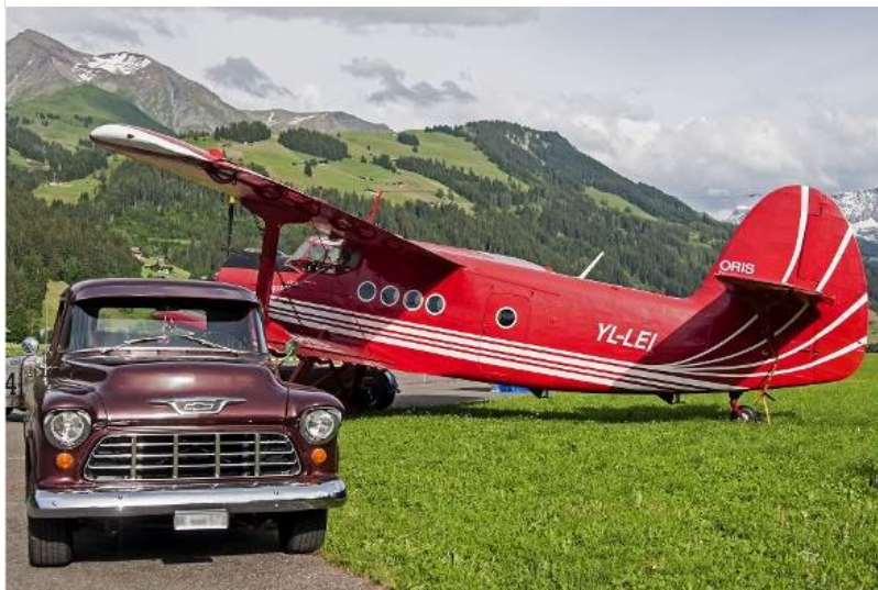
Wer wollte, konnte sich dieses Jahr mit dieser «Antonov» stiehlt vom Flughafen Birrfeld nach St. Stephan und wieder zurück fliegen lassen.