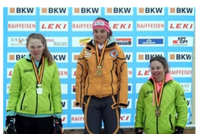
JO BOSV-Meister 2015 im Slalom