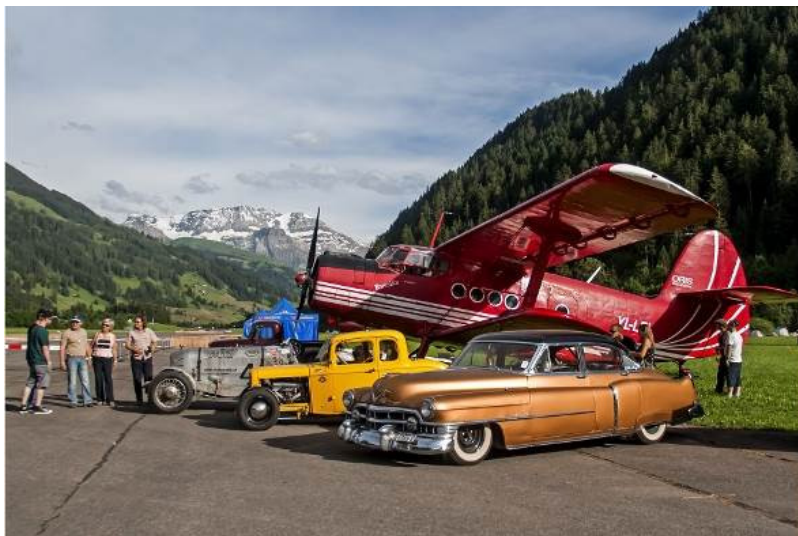
Die «Antonov» und erste Oldtimer vor dem eindrucklichen Panorama auf dem Flugplatz St. Stephan.